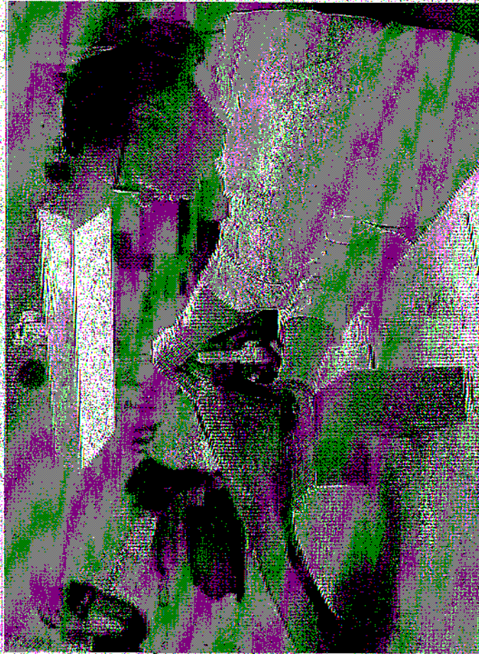
Faut-il restaurer les objets des déportés, comme la cette valise ? Et si oui, comment ? Jusqu'où ? C'est ce qu'interroge le documentaire. REDRO : LA VOIX

modestie de ne pas juger ce sujet qui nous dépasse tout, mais, en philosophie, interrogé avec précision. ■ L.D. « Auschwitz Museum » (produit par les Bets du Nord) ce soir à 22 h et demain 09 h 10 sur LCR/Publie Sénet.